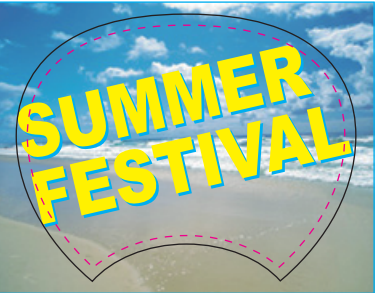
文字が仕上りギリギリまで あるデータ