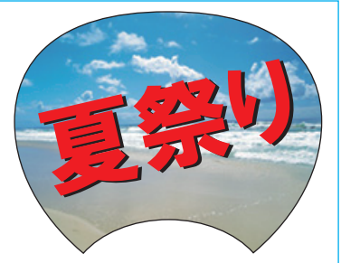
塗り足しの無いデータ