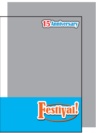
上の文字と下部のみ白版の場合 (白版を引いた部分以外は透けます。)