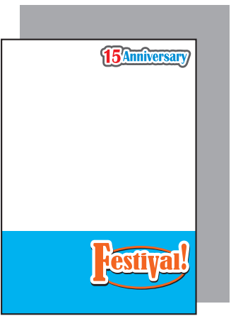
全面白版の場合 (全体に背景が透けにくくなります。)

クリアファイルの素材は透明なので、透けさせたくない部分と 白色で表現したい部分は、K100% (黒) で白版を制作してください。